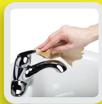
7 FERMER AVEC LE PAPIER